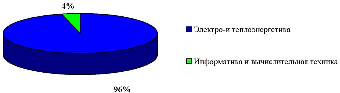
Рисунок 1 – Структура основных профессиональных образовательных программ по профилям подготовки

В процентном отношении от общего количества специальностей, спектр программ можно представить в виде нижеприведенной схемы.